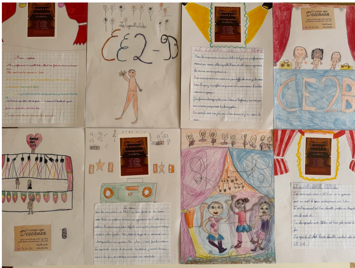
Les élèves de Ce2 B ont fait un travail en expression écrite sur le projet danse à découvrir ci-dessus.