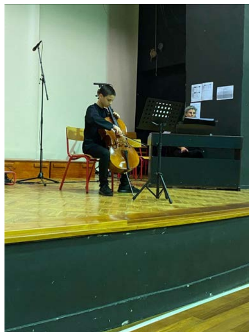
(Communauté scolaire) Vendredi dernier s'est déroulé un magnifique concert au gymnase du secondaire. Plus de 200 spectateurs ont pu profiter d'un concert de la chorale et de